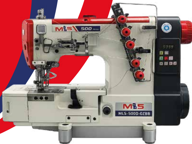
Ref. MLS-500d-02bb Imagen de referencia

La máquina collarín recubridora mecatrónica de 3 agujas está diseñada para materiales livianos y semipesados. Ideal para sesgado, encauchado, dobladillos y terminaciones elásticas. Cuenta con luz incorporada y motor Direct Drive para mayor precisión, ahorro de energía y menor ruido.