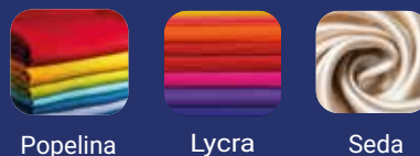
Popelina Lycra Seda