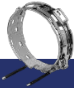
ANILLOS DE GORRAS