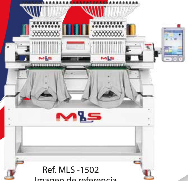
Ref. MLS -1502 Imagen de referencia

Bordadora industrial de 2 cabezas y 15 agujas, diseñada para alta productividad y precisión en bordado de prendas, gorras y campo abierto. Ideal para producción profesional.